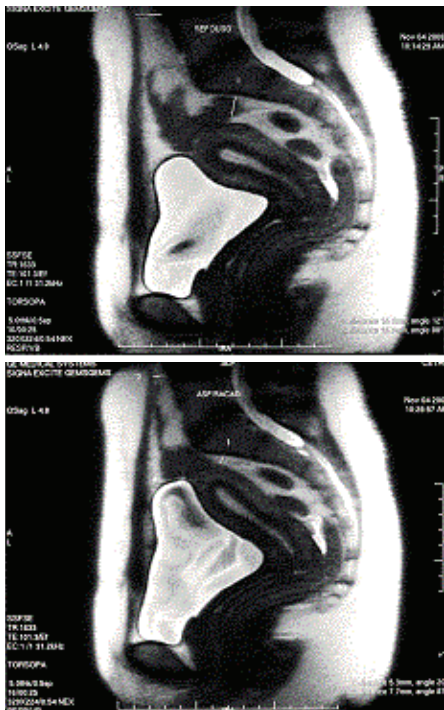
Figura 2 - Imagens de ressonância magnética mostrando o comportamento da musculatura abdominal, útero e vagina durante a manobra de aspiração diafragmática.

A primeira imagem mostra os músculos abdominais durante o repouso, e a segunda durante a manobra de aspiração diafragmática. O ângulo entre útero e vagina muda de 31° em repouso (cima) para 45° graus após a manobra (baixo).